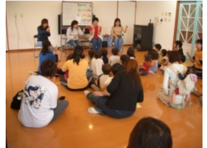
[ 6/15 (水) 「ひなたぼっこの会」による絵本読み聞かせより ]

ました。次回 11月16日(水)「ひなたぼっこの会」の方の読み聞かせを楽しみにしててください。